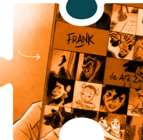
PLANCHE À 3 EXPOSITION